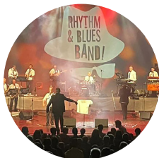
Rhythm & Blues Band