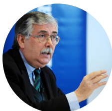
Gian Antonio Stella