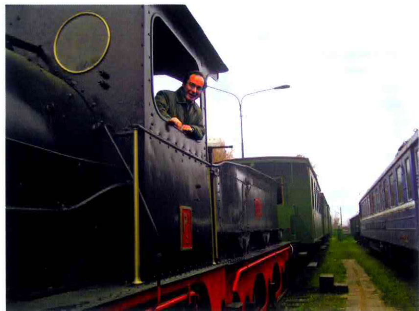
Romano Vecchiet su un'antica locomotiva a vapore in Bulgaria